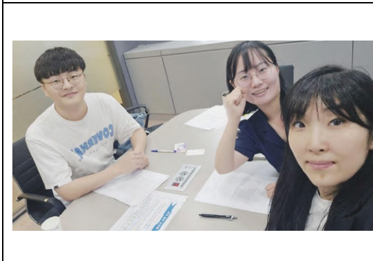
拜訪移民支援公益中心「感謝與同 行」(감사와 동행)。