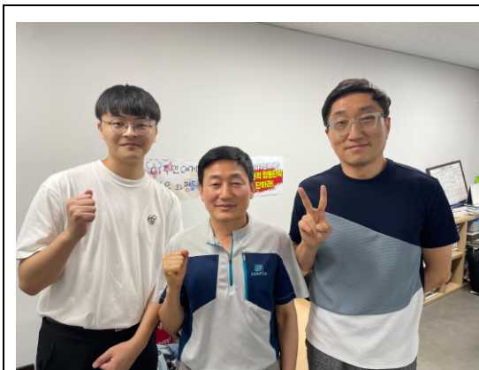
拜訪韓國移工工會 (이주노동자노동조합)。

熟識，也會在政策倡議上集體行動。令我印象深刻的是在移地研究期間，韓國京畿道華城市的一座鋰電池工廠不幸發生工安意外，引發的大火導致 23 人喪命，當中有 17 人是來自中國的朝鮮族勞工。我有關注和接觸的幾個公民團體旋即展開合作，發出集體聲明來要求有關部門徹底調查和改善移工工作環境等等，足見韓國公民社會的活力。