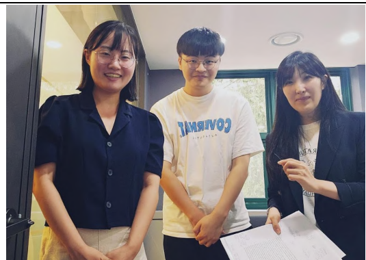
拜訪移民支援公益中心「感謝與同 行」(감사와 동행)。