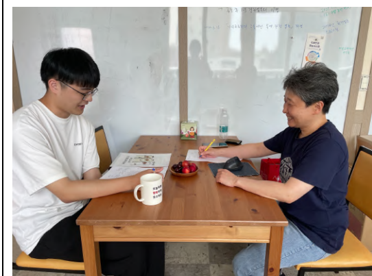
拜訪移住與人權研究所 (이주와 인권연구소)。