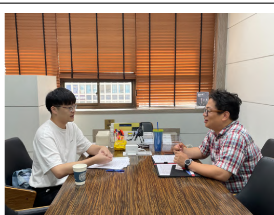
拜訪「移住民中心 朋友」 (이주민센터 친구) 主任。