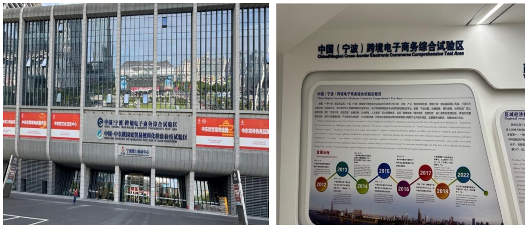
圖六：中東歐國家特色展覽館展示