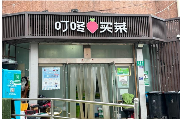
圖四：叮咚買菜外送員