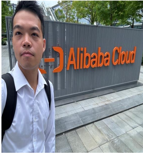
圖八：阿里雲標誌合影 ( 左 ) 阿里集團員工 ( 右 )