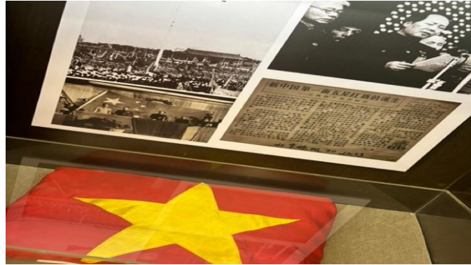
圖十：北京東城區服飾瑞蚨祥與共產黨合作第一面紅旗

得緊密，兩者即是奠基在政治掛帥之上做發展，雖然僅是從旅遊點景點的商業區進行側面了解，但仍可以看到許多地方都有「紅色資本」的影子（圖十）。